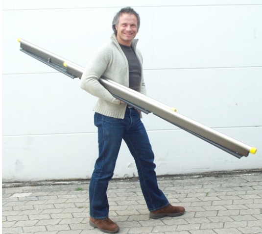
Klappbar und leicht

TÜV Baumusterprüfung - hoher Sicherheitsstandard