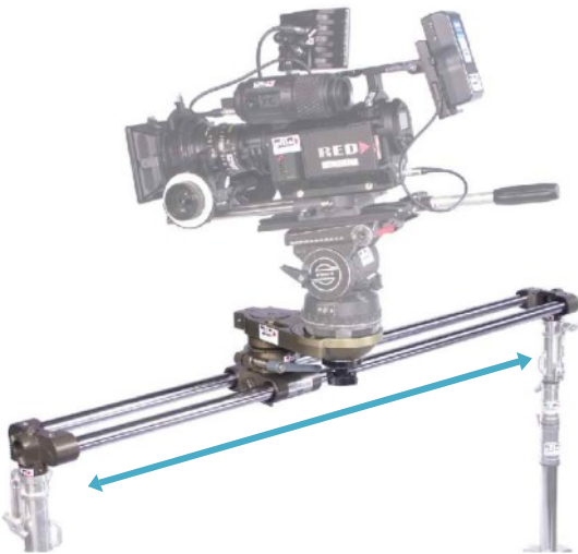
GF-Mini Bangi mit 150cm Rohre auf 2 Lichtstative

Aufgrund seines geringen Gewichts eignet sich der GF-Mini Bangi ideal auch für den Einsatz als Car-Rig oder aber an der Front eines Jib-Arms zum Ausgleich des Radius, den jeder Jib-Arm beim Schwenken verursacht.