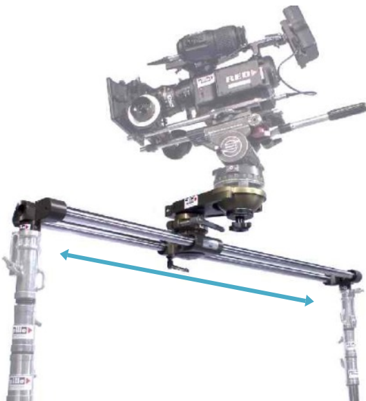
GF-Mini Bangi mit 150cm Rohre auf 2 Lichtstative