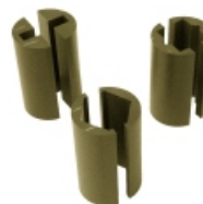
Einsätze für Rohr-Schellen