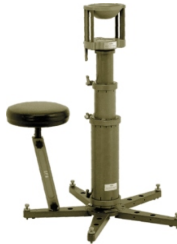
Sitz und verstellbare Bazooka