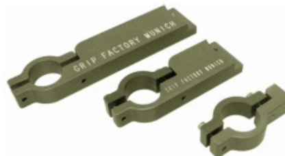
Adapter für Mannesmanrohr