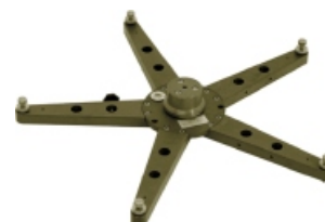
Maxibodenstern mit 5 Armen